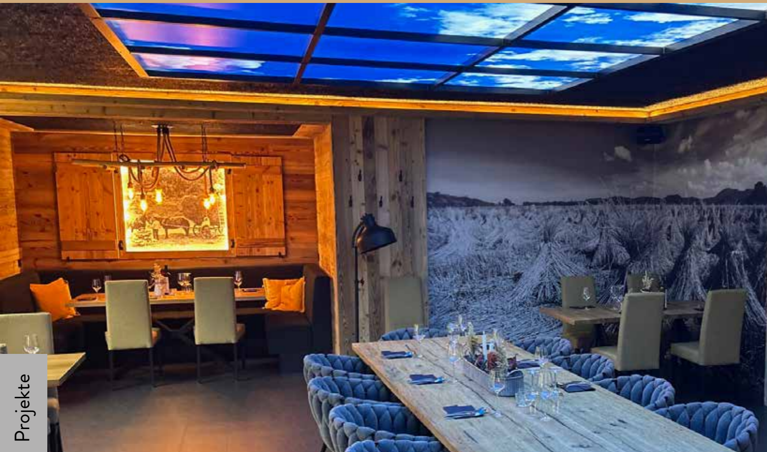
Das Highlight des Saales ist jedoch die Decke. Ein indirekt beleuchteter Sommerhimmel dominiert den Raum und verzaubert mit einem fantastischen Ambiente die Gäste.